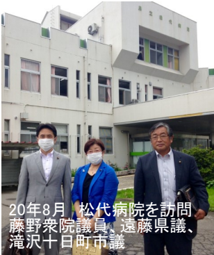
20年8月 松代病院を訪問 藤野衆院議員、遠藤県議、滝沢十町市議

医療・介護・教育・農業・商業など、人に温かく暮らし優先の財政運営に切り替えて、県財政を活性化させましょう。